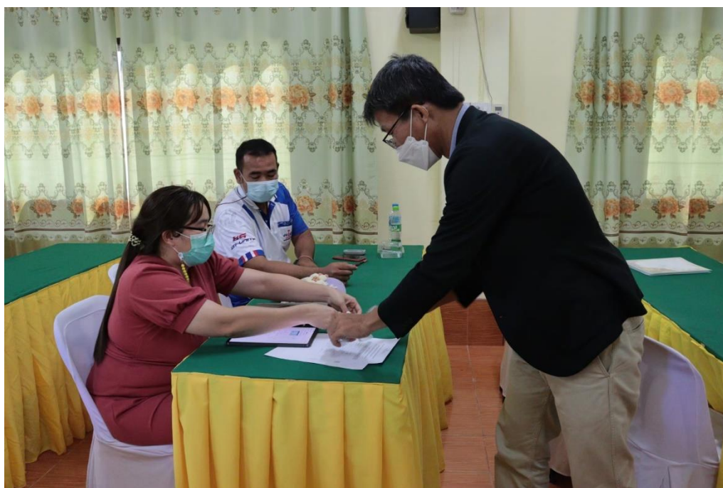
การอบรม เรื่อง โครงงานจาก Microcontroller