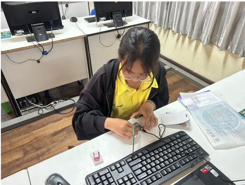
นำอุปกรณ์ และความรู้ที่ได้รับจากการอบรมมาจัดการเรียนการสอน รายวิชา การออกแบบและเทคโนโลยี ม.4