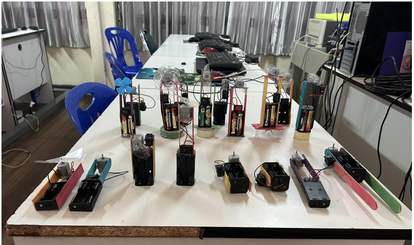
การจัดการเรียนการสอน เรื่อง การออกแบบเทคโนโลยี