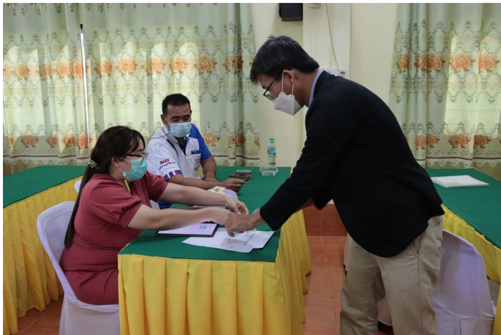
การอบรม เรื่อง โครงงานจาก Microcontroller