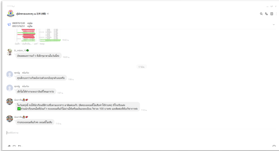
Line ผู้ปกครอง ม.๑/๔