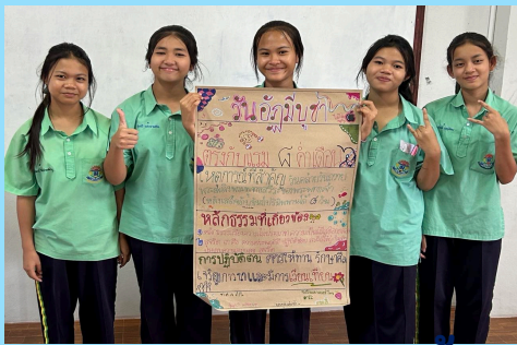
นำเสนอผลงานหน้าชั้นเรียน

ดำเนินการวัดและประเมินผลการเรียนรู้ตามสภาพจริง