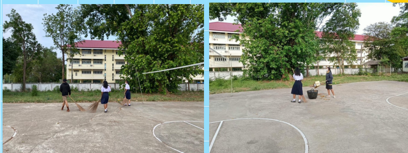
การทำเขตรับผิดชอบ

ปลูกฝังนักเรียนให้มีความรับผิดชอบและมีระเบียบวินัยในตนเอง