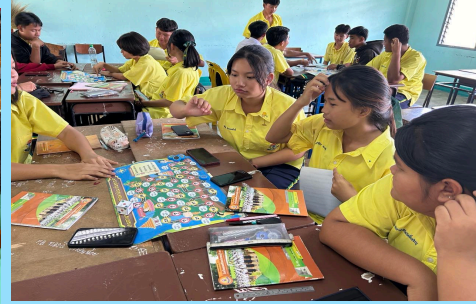
ประเมินจากชิ้นงานของผู้เรียน