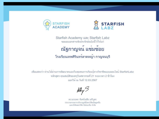
คุณสมบัติของครูใน ศตวรรษที่ 21