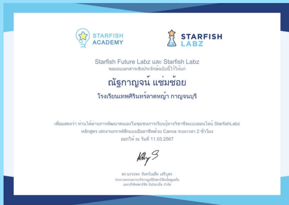
เสกงานกราฟฟิกแบบมืออาชีพด้วย Canva

มีการพัฒนาตนเองอย่างเป็นระบบและต่อเนื่อง เพื่อให้มี ความรู้ความสามารถ ทักษะ โดยเฉพาะอย่างยิ่งการใช้ภาษาไทยและ ภาษาอังกฤษเพื่อการสื่อสาร และ การใช้เทคโนโลยี ดิจิทัล เพื่อ การศึกษา สมรรถนะวิชาชีพและความรอบรู้ในเนื้อหาวิชาและ วิธีการสอน และ นำผลการพัฒนาตนเองและพัฒนาวิชาชีพมาใช้ในการ จัดการเรียนรู้อที่มีผลต่อคุณภาพผู้เรียน