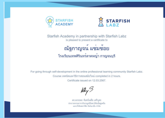
เทคนิคและวิธีการสอนสมัยใหม่