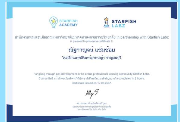
ลิขธิหน้าที่พลเมืองดีตามวิถีประชาธิปไตย