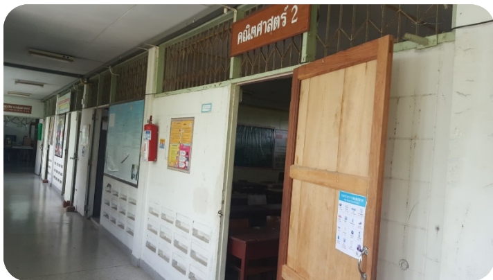
ห้องคณิตศาสตร์ 2 ห้อง 223