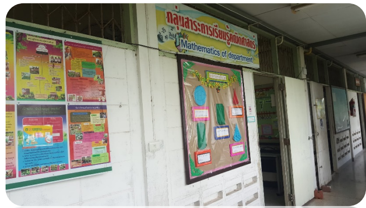
ห้องคณิตศาสตร์ 1 ห้อง 222