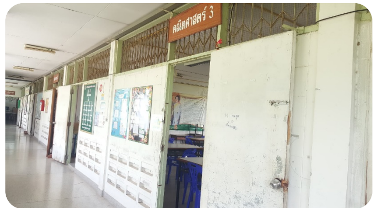
ห้องคณิตศาสตร์ 3 ห้อง 224