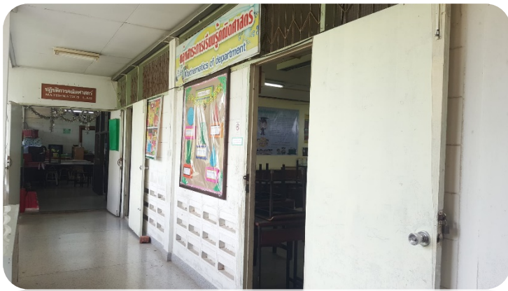
ห้องปฏิบัติการทางคณิตศาสตร์ ห้อง 221

➤ กลุ่มสาระการเรียนรู้คณิตศาสตร์มีห้องปฏิบัติการและห้องเรียนจำนวน 4 ห้อง ดังรูป