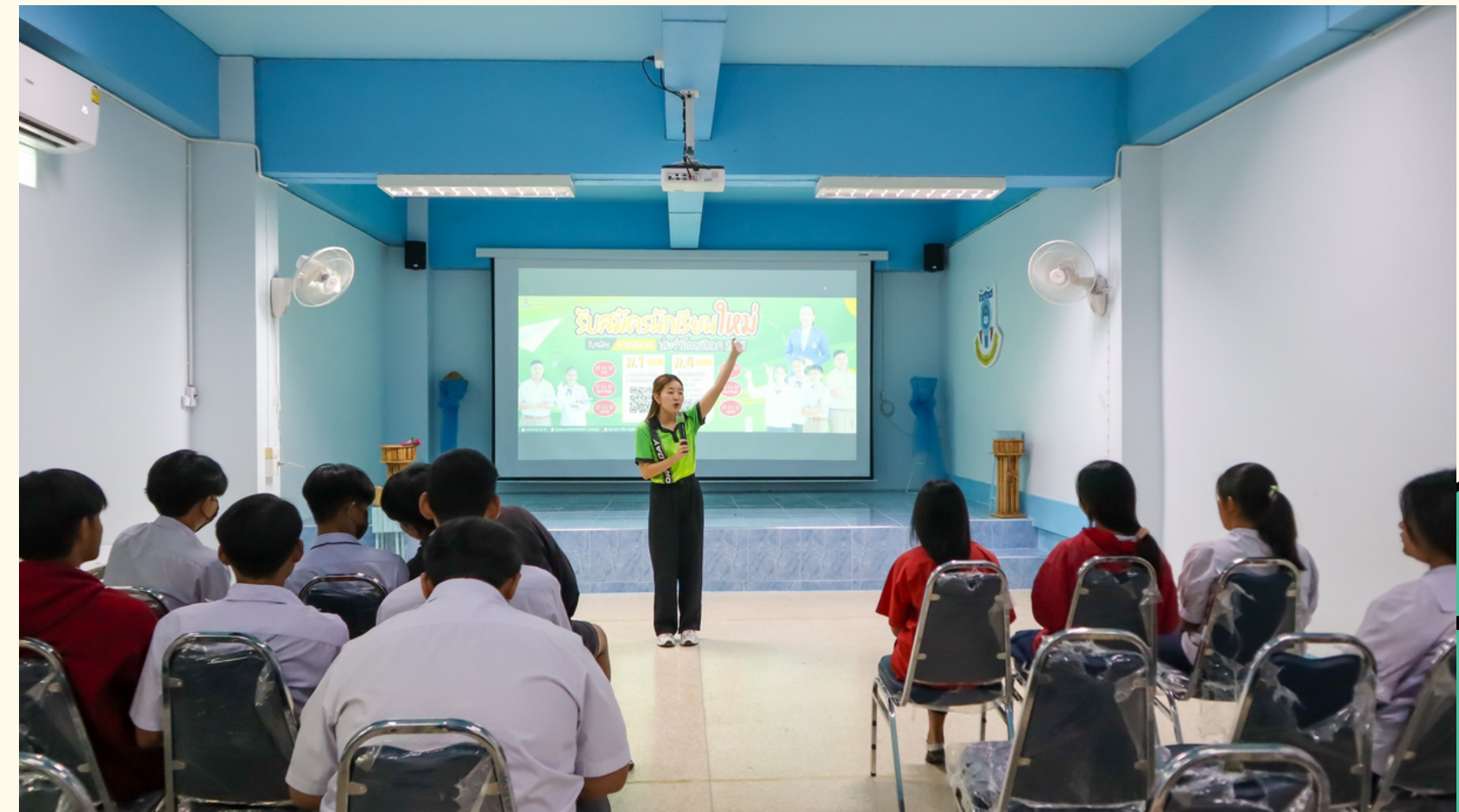
กิจกรรมแนะแนวสู่อาชีพ ปีการศึกษา 2566