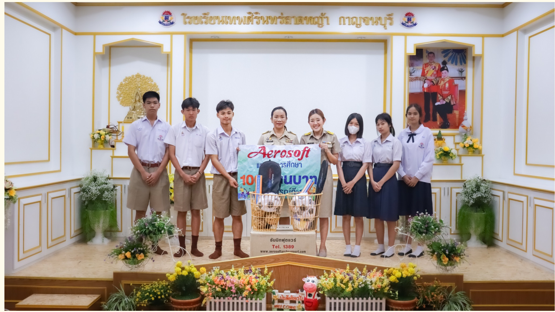
ดูแลประสานงานเรื่องทุนการศึกษา