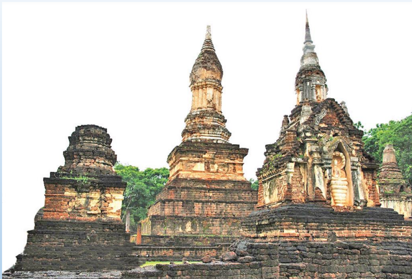
เจดีย์ทรงพุ่มข้าวบิณฑ์ วัดมหาธาตุ จังหวัดสุโขทัย