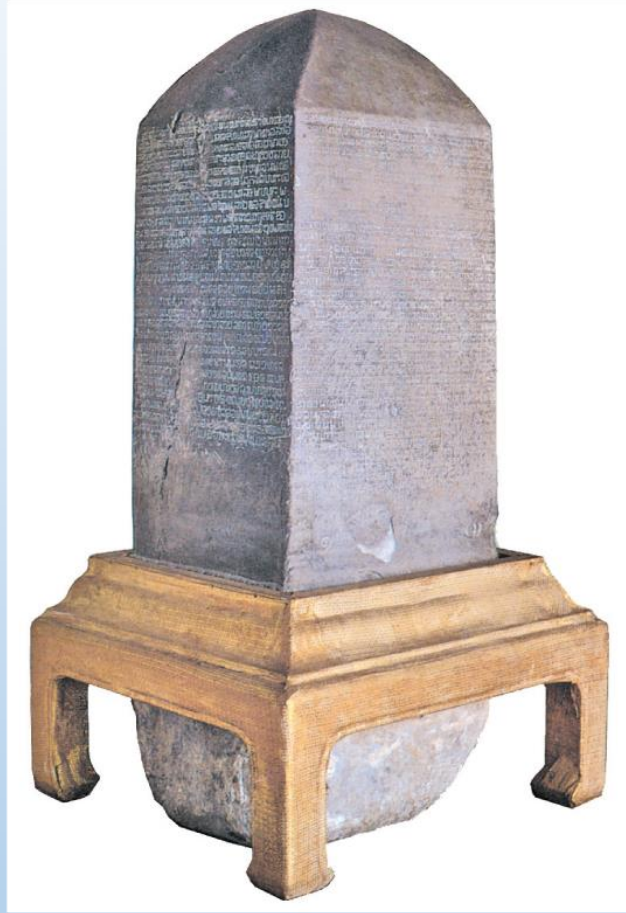
หลักศิลาจารึกพ่อขุนรามคำแหงมหาราช จารึกสุโขทัยหลักที่ ๑