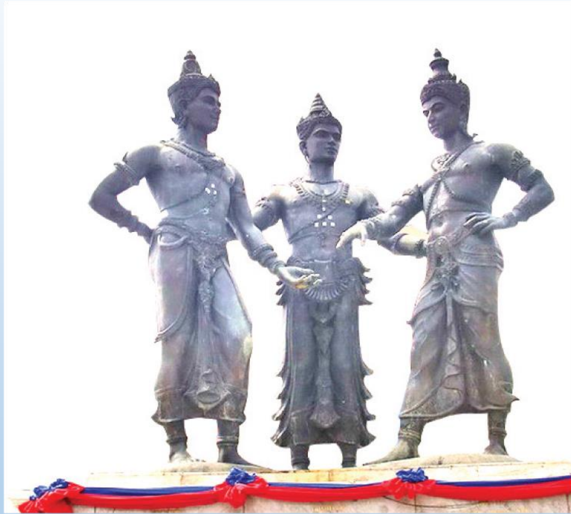
พระบรมราชานุสาวรีย์สามกษัตริย์ ตั้งอยู่หน้าศาลากลางเก่า จังหวัดเชียงใหม่