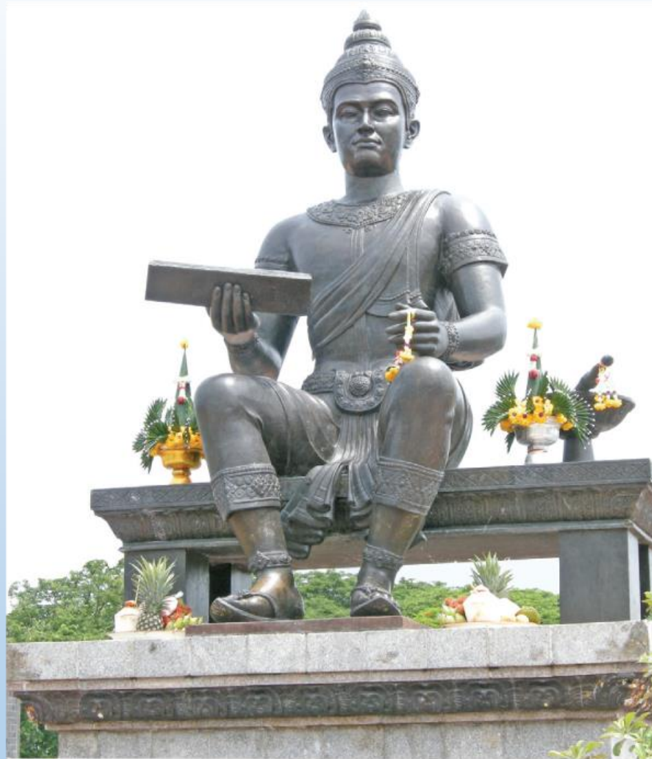
พระบรมราชานุสาวรีย์พ่อขุนรามคำแหงมหาราช ณ จังหวัดสุโขทัย