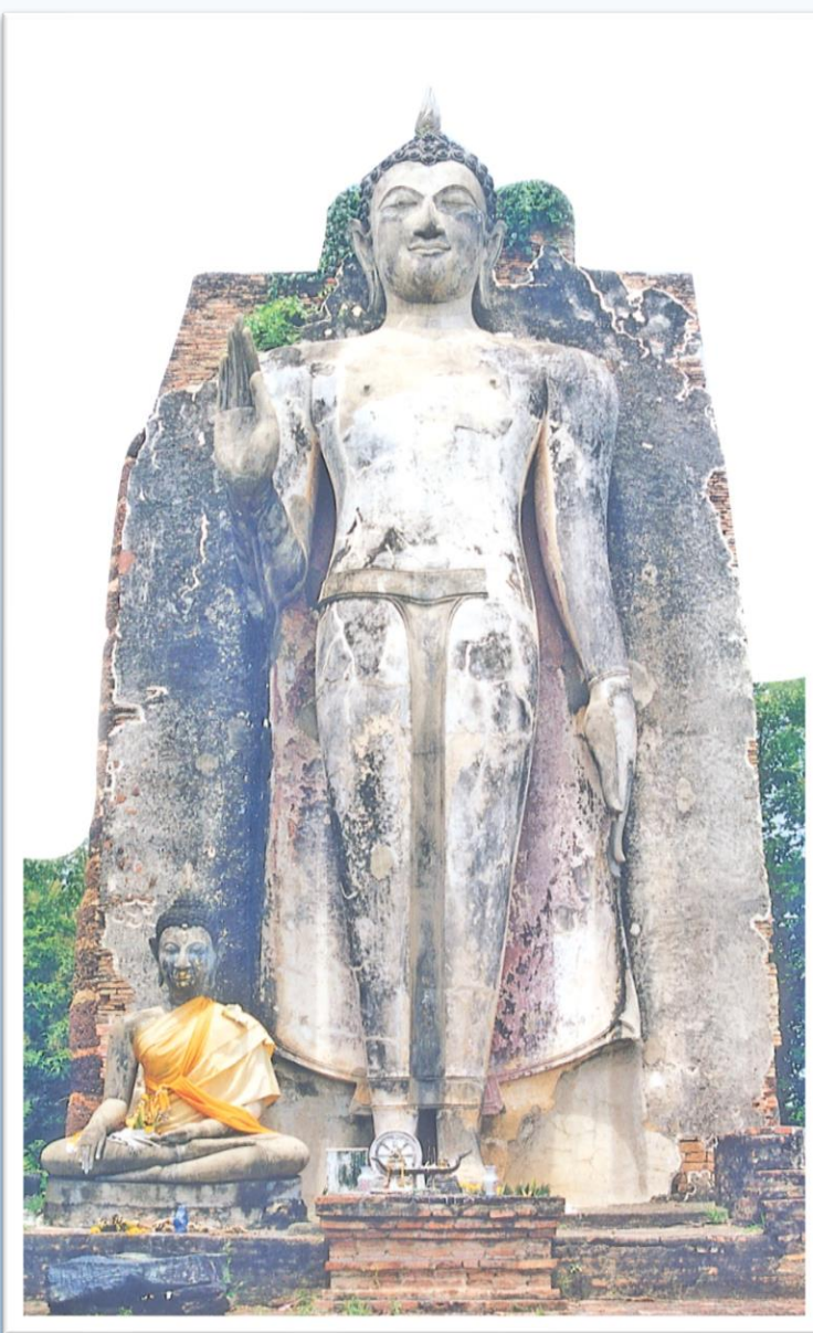
พระพุทธรูปปางประทานอภัย วัดตะพานหิน จังหวัดสุโขทัย