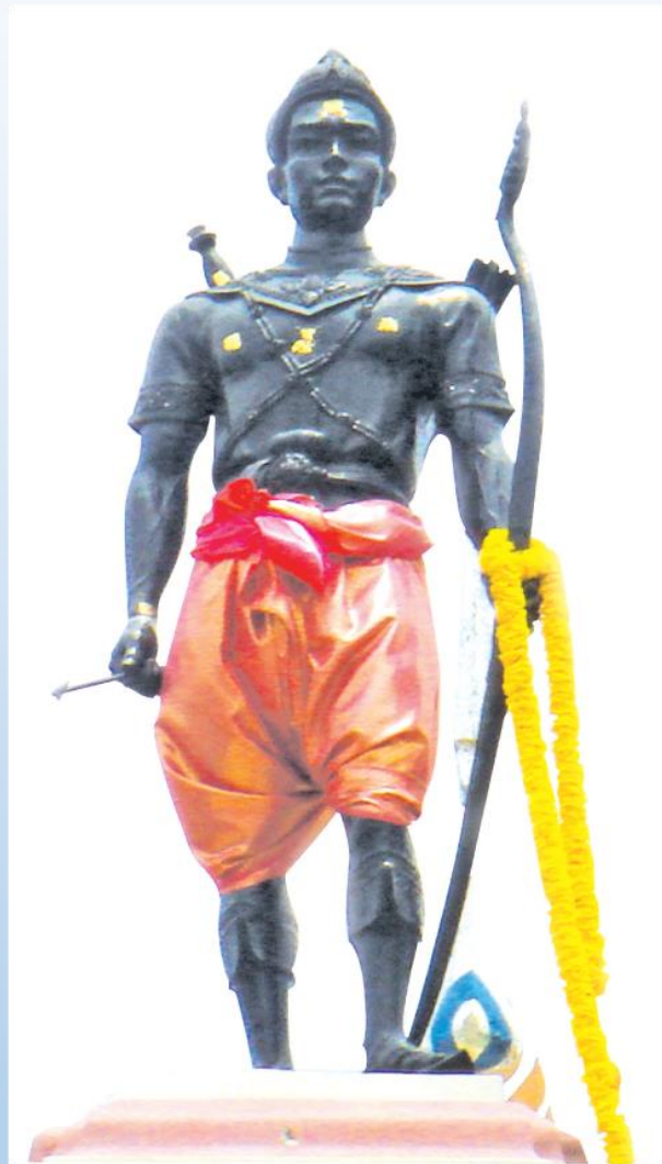
พระบรมราชานุสาวรีย์พ่อขุนศรีอินทราทิตย์ ณ จังหวัดสุโขทัย