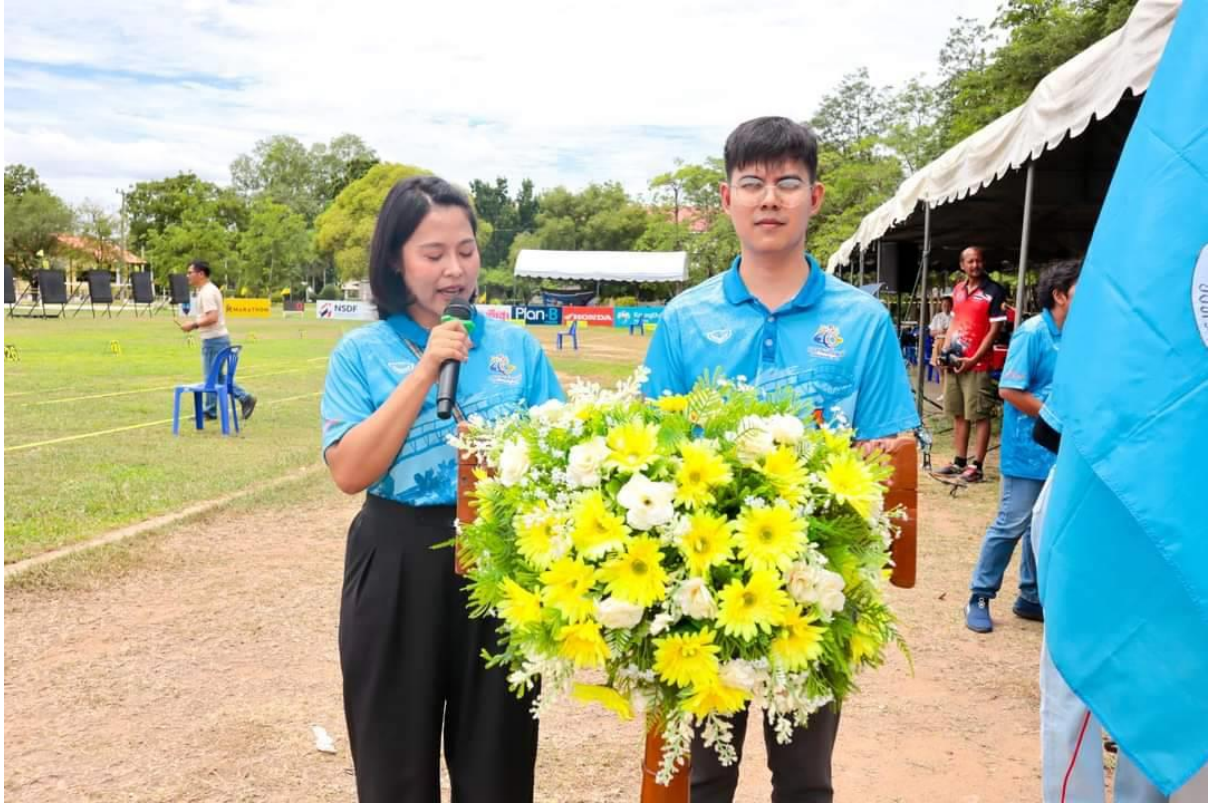
กิจกรรมกีฬาแห่งชาติ กาญจนบุรีเกมส์