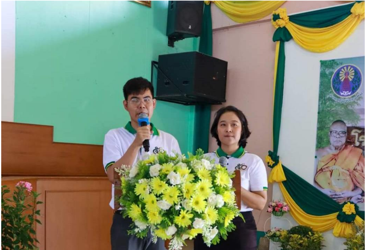
งานครบรอบ 50 ปีโรงเรียนเทพศิรินทร์ลาดหญ้า กาญจนบุรี