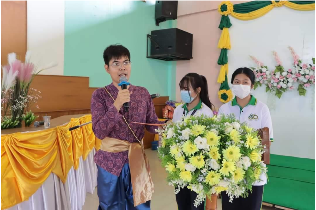
กิจกรรมวันภาษาไทย