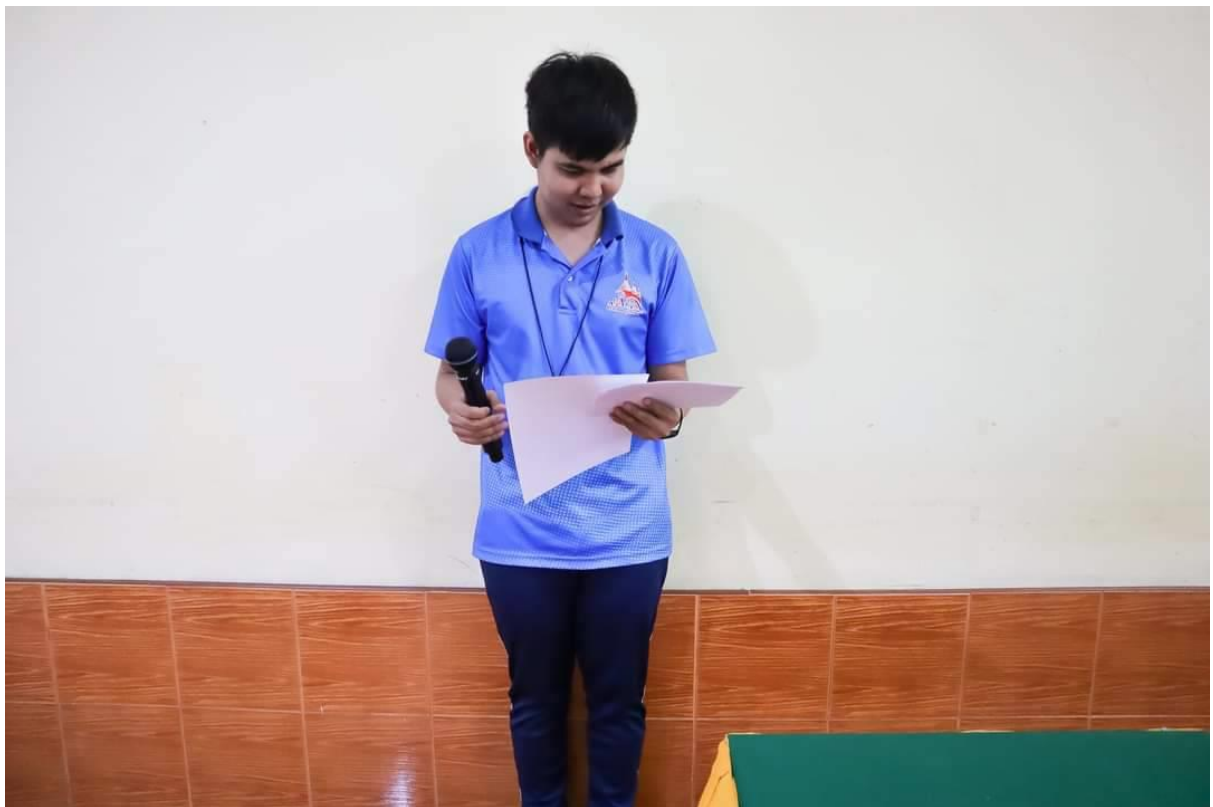
พิธีกรการประชุมงานต่างๆของโรงเรียน