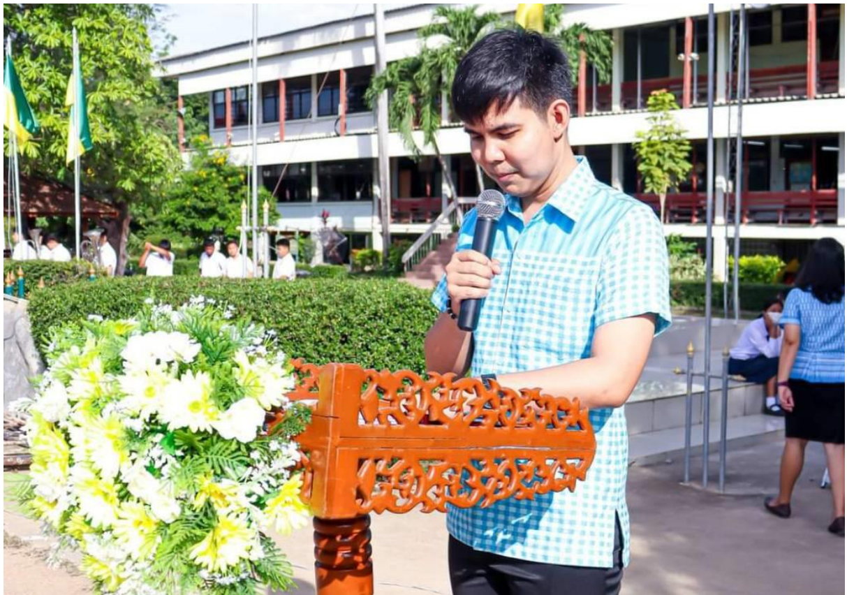
กิจกรรมวันแม่แห่งชาติ