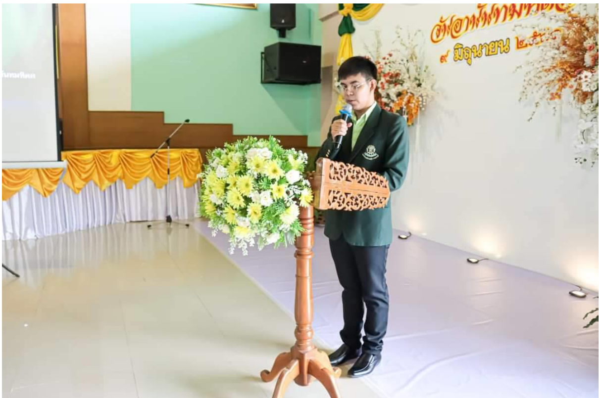
กิจกรรมวันอานันทมหิตล