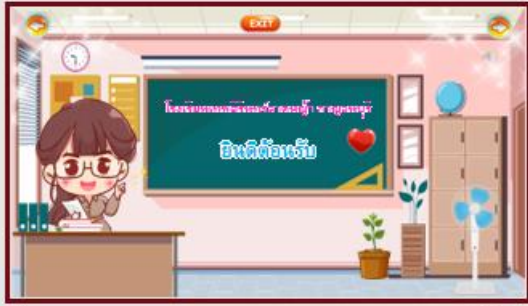
1 ★ 00:02