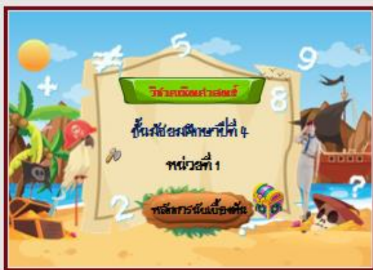
1 ★ 01:37