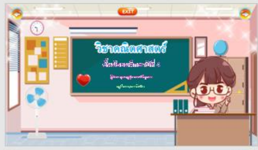
2 ★ 00:02