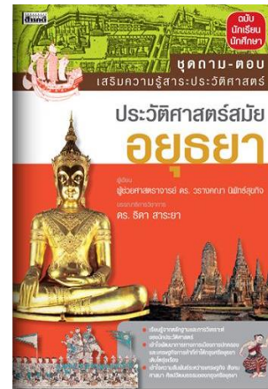
ภาพหนังสือประวัติศาสตร์สมัยอยุธยา