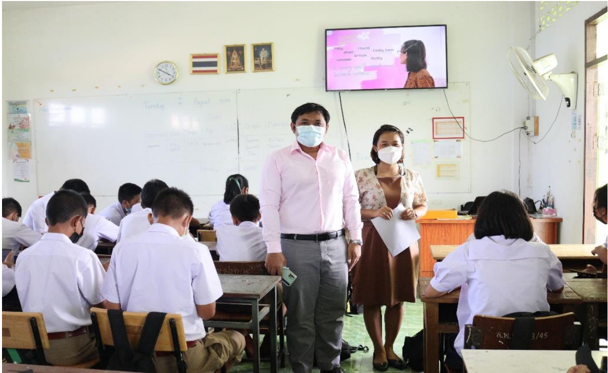
มีการนิเทศ ติดตาม ประเมินผลการดำเนินงานอย่างต่อเนื่อง